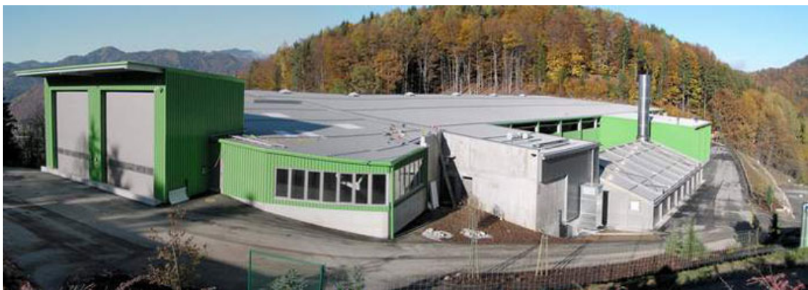
MBA Frohnleiten